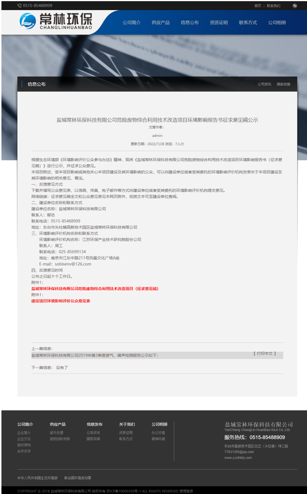
图3-1 报告书征求意见稿公示