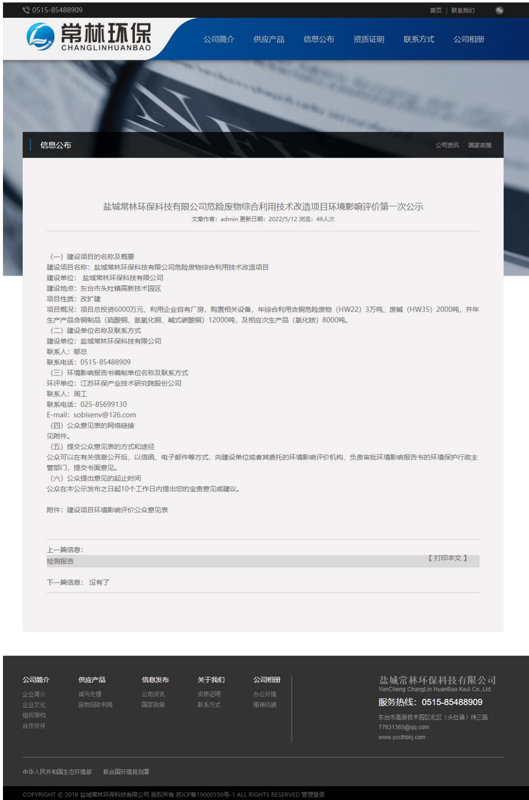
图 2-1 第一次公示截图